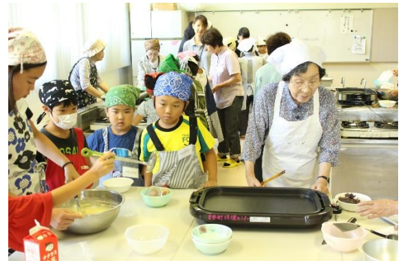
あんこを丸めたり、ホットケーキを焼いたりしました!

参加者の方は「家に小さな子どもがいないので、久しぶりに一緒に作れて楽しかった」「子どもたちが上手に焼いていて驚いた」と話され、楽しい時間を過ごされていました。