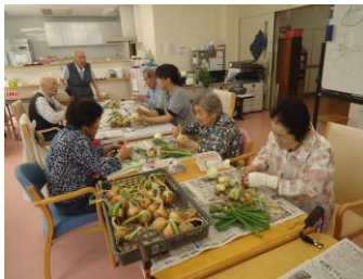
玉ねぎの皮むきレクリエーション?