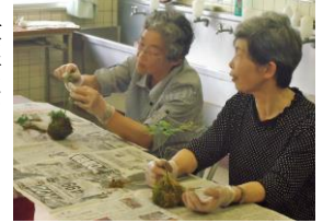
山から採った天然苔で製作