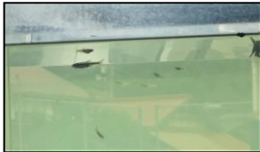
写真より実物をご覧ください。

デイサービスルームの癒しにと小川でメダカをすくって水槽に入れましたが、段々大きくなる姿に、どうやらドロバエみたいですよ(笑)