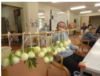
こうしてまずは鑑賞!そして食べる。